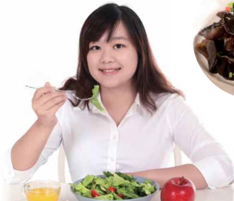
女性朋友建議多吃綠色蔬菜，保養肝臟健康。

但您知道造成皮膚的暗沉，男生和女生原因大不同嗎！在一般的皮膚科或醫美診所，只簡單的跟您說，由您肌膚的情況來判斷您是油性、乾性還是混和肌、敏感肌，提醒您要多補充水份、蔬果，少吃油炸類。但在中醫來說，若女性肌膚暗沉，大多是肝出了問題，而男性則較有可能是腎的問題，所以關鍵之道，要從體內的健康與保養做起，確認臟腑之間的協調，千萬別只做「表面功夫」喔。