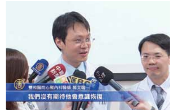
院方醫師說明洪先生當時的治療情況

古時候的書籍，不少見這方面的記載。一部記載了許多神奇事物的、晉朝干寶所著的《搜神記》當中，看到「王道平妻」、「河間郡男女」、「賈文合娶妻」、「方相腦」、「史狗神行」……許多的這類案例。以前，看到書名叫做「搜神」，以為是找尋「神」或另外空間的其它生命。其實，它的記載卻非常類似現在的「新聞蒐奇」。有了爆發性的神奇新聞，現在的媒體就立刻派出文字記者、平面攝影記者、SNG 記者……等到現場，做現場報導；或採訪當事者，或採訪周邊行人，或採訪熟識當事者的人們……；其中也不乏神奇到不能用科學合理解釋的，可是在整個社會「排神」氛圍下，常見的播映方式是 (1) 使用偏頗或鄙視的語言帶過，或 (2) 放在小眾節目中播映。