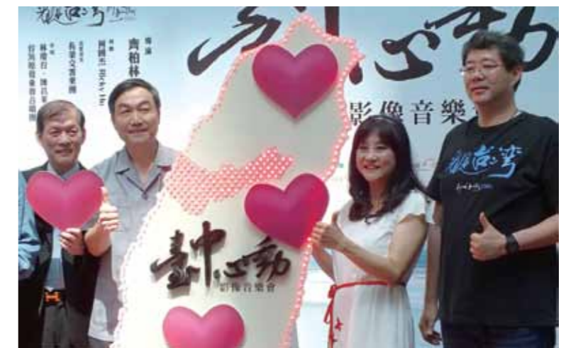
2014 年 8 月 8 日，《心動台中》發佈記者會。齊柏林跨刀以空拍方式記錄「不一樣的台中」。

時任內政部長李鴻源 (2013.12.04) : 「清境這件事情，它叫做超限利用，那超限利用它牽扯的就是，第一個它有沒有執照？第二個，對霧社水庫的破壞非常的嚴重，然後我們要來取締，那現有的這些假如它都是合法的，如何讓它修改到符合所謂的低衝擊開發。」不搭調的歐風民宿，風災後成堆的漂流木，變色的後勁溪，光禿的山頭，傾頹的房舍，泡在海中的墓地，如此怵目驚心，當年政府曾組專案小組，列管 16 項，只是沉痾已久的結構性環境問題，依舊被輕輕放下，又或者，權力者從來都擅於遺忘。五年之後，亞泥只是，挖得更深。