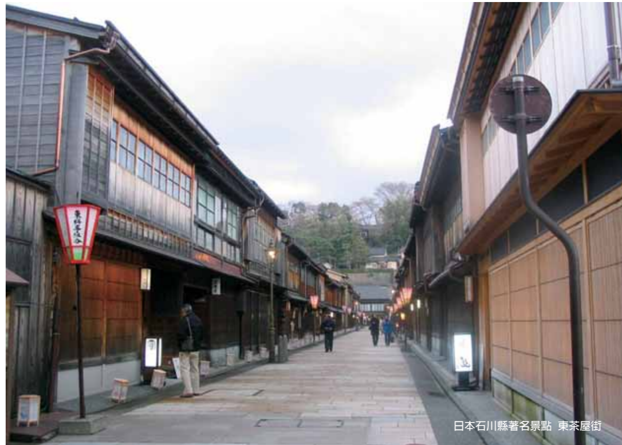
日本石川縣著名景點 東茶屋街