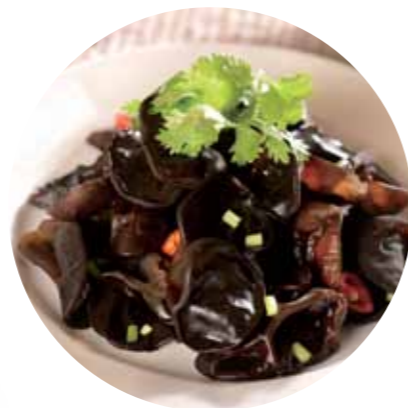
男性朋友建議多吃黑色食物，保養腎臟健康。