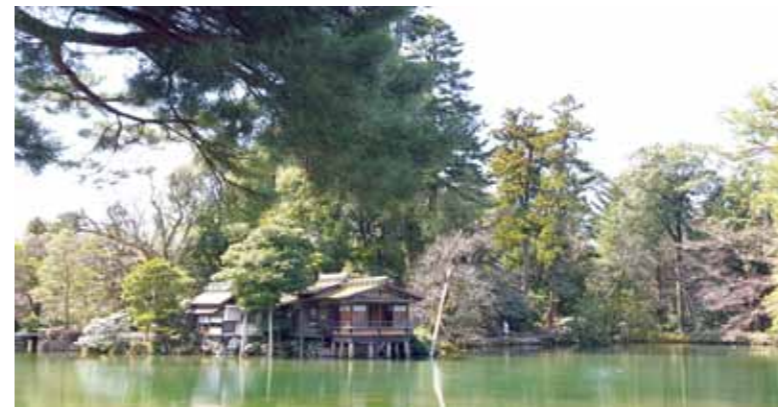
左下：石川縣兼六園