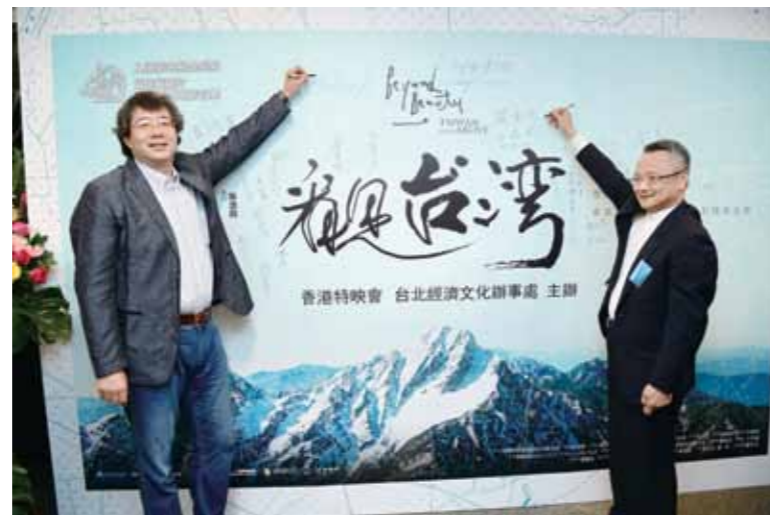
2014 年 4 月，齊導前往香港，盼喚醒香港民眾環保意識。