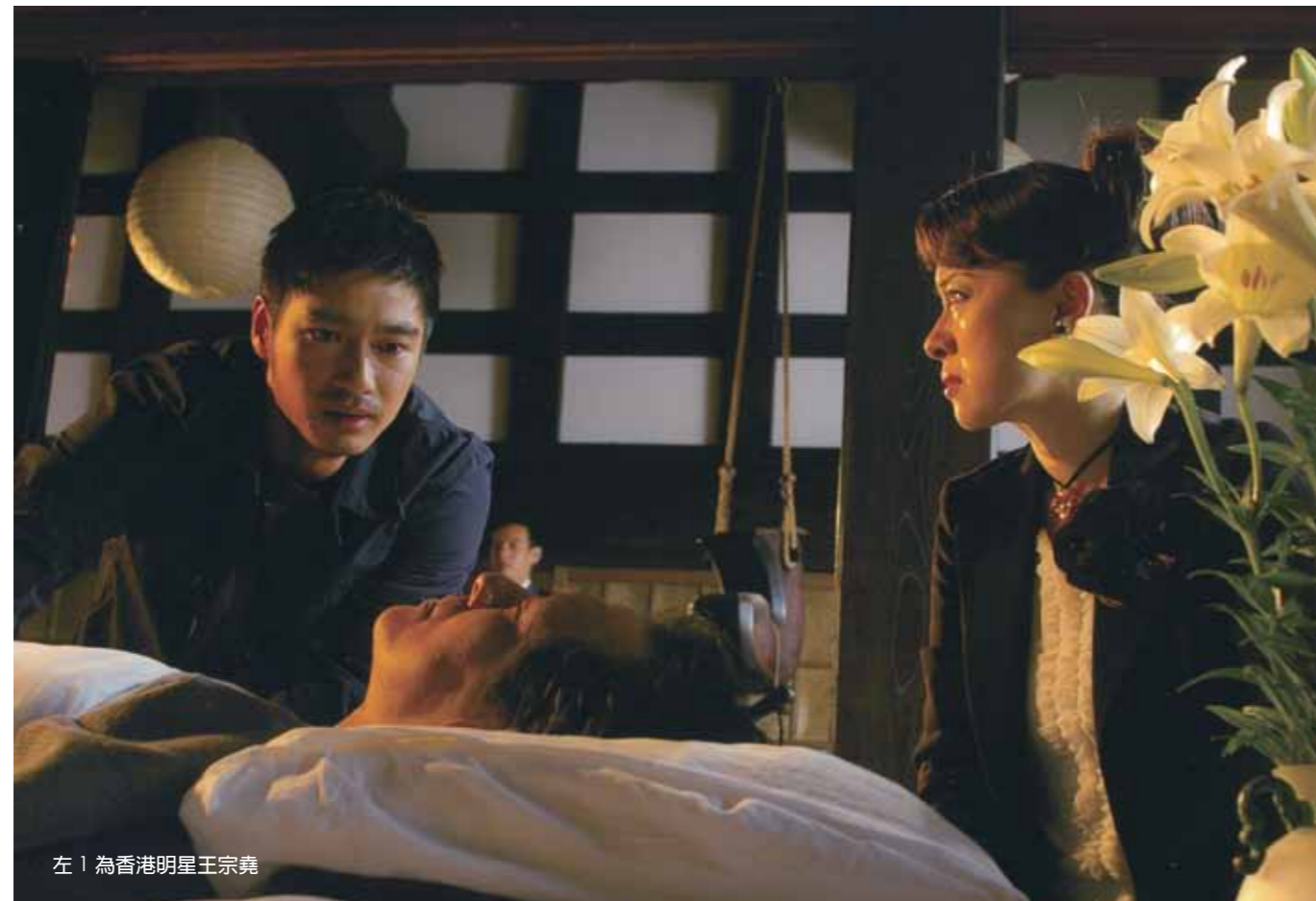
左 | 為香港明星王宗堯