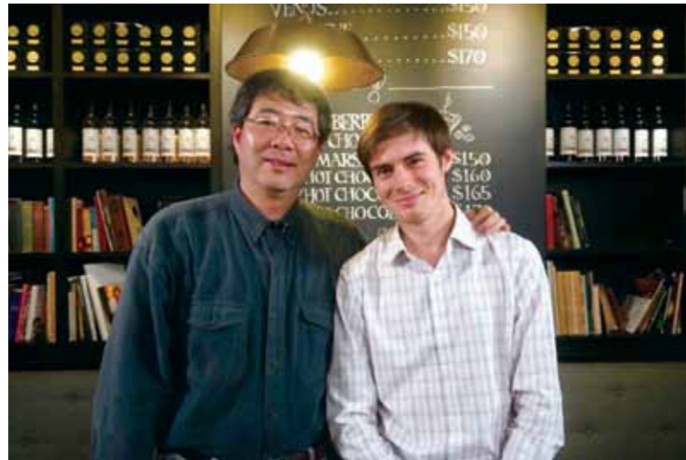
2014年3月，本台「老外看中國」節目主持人郝毅博專訪齊柏林導演當時之合照。

導演吳念真 (2017.6.8) : 「你看到很多事情叫政府做，那不夠，政府永遠最慢，因為它要預算、它很多事情、它要權力鬥爭，不可能的，所以我一直認為，台灣很多事情很可愛的地方，是因為我們看到了，我們就去做了。」