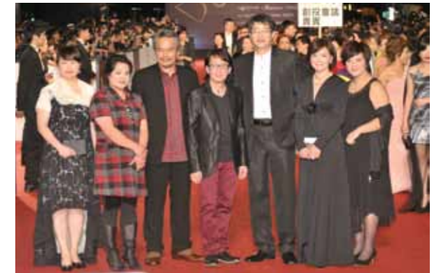
2013年《看見台灣》獲得金鐘最佳紀錄片獎，劇組們走紅毯。