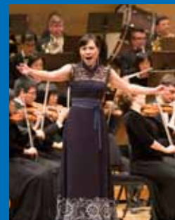
耿皓藍 / 女高音聲樂家 Haolan Geng

年代售票 | 7-11 ibon | 全家 FamiPort 萊爾富 Life-ET | OK 超商 OK.go