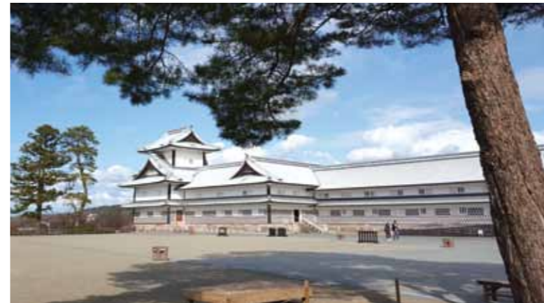
左上：石川縣金澤城

由於《花之戀》在日本主要投資者是石川縣政府，內容自然涵括上述精緻優美的文化資產。張玲惠不但親自考察各地景點，更下足功夫研究當地各項文化。她將一己體會與日本 NHK 資深導播岸田利彥一同