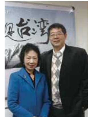
2014 年 12 月 8 日，導演齊柏林前往紐約，在臺灣會館分享心得。左為臺灣會館理事長陳春蘭。

《齊柏林：高空捕捉台灣之美》(2012) : 「20 多年來，就是從事平面空中攝影的工作，拍了超過 30 萬張的台灣地理空拍影像，我只拍台灣，因為我跟台灣的土地談了一場戀愛。然後台灣的环境哪裡美麗、哪裡有傷痕，我大致上都瞭解。」