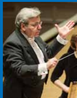
米蘭·納切夫 / 指揮 Milen Nachev