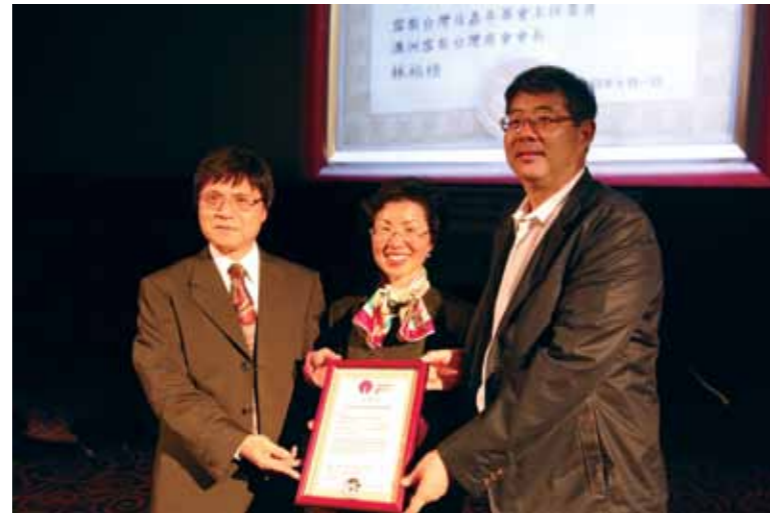
2014 年 7 月 1 日《看見台灣》在雪梨劇院 Event Cinema 首映，駐澳洲台北經濟文化辦事處張小月代表 (中) 及台灣日嘉年華會召集人林柏梧 (左) 向齊柏林導演頒發感謝狀。

導演吳念真 (2013.10.1) : 「一個最大的感覺是，有一個成語必須要改變，『人定勝天』，沒有，人勝不過天，對，今天從這塊土地所掠奪的，到有一天，天會從你身上再把它拿回來。」毫無節制地掠奪定會引起反撲，齊柏林飛得夠高，從天際鳥瞰大地傷痕，反而更懂得謙卑面對土地，我們也才發現，環境議題，原來還能動員這麼多民間力量，在台灣，或許也唯有齊柏林。