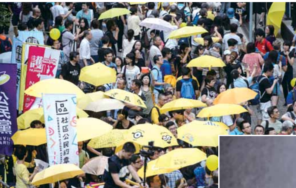
2014 香港運動，明筑前往香港採訪