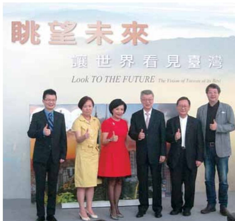
2015年6月25日，臺北101舉行《眺望未來——讓世界看見臺灣》專刊新書發表會。

看見之後，付諸行動，勇敢面對問題。齊柏林飛上青天，卻始終心繫土地，從高中就受劉克襄的啟發走上攝影路，2005年的《悲歌美麗島》，早已負向勾勒出《看見台灣》的雛型，後又因演講時學生打瞌睡，憤而萌生拍片念頭，莫拉克風災後，齊柏林更心心念念，效法《盧貝松之搶救地球》，溫熱世人的無知與冷漠。