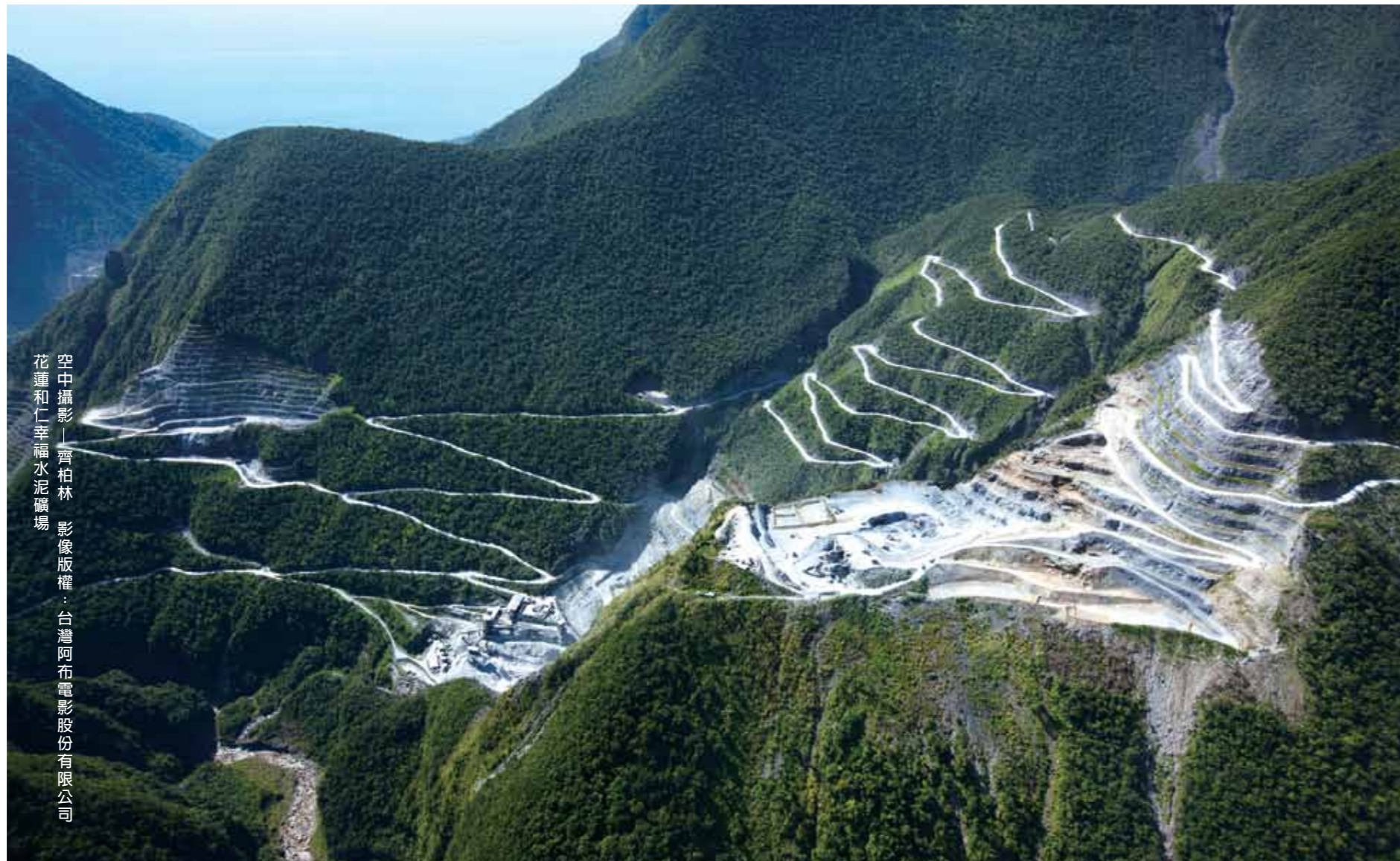
花蓮和仁幸福水泥礦場

6月10日中午，傳來《看見台灣》的導演齊柏林，搭乘直升機墜毀的消息，一時之間，許多人不敢置信，因為兩天前，他還壯志凌雲的，宣告投入續集拍攝，當許多人感嘆天地痛失英才的同時，我們帶您看見，齊柏林和他的《看見台灣》，到底留下了什麼？他的精神，又是否能夠延續下去？