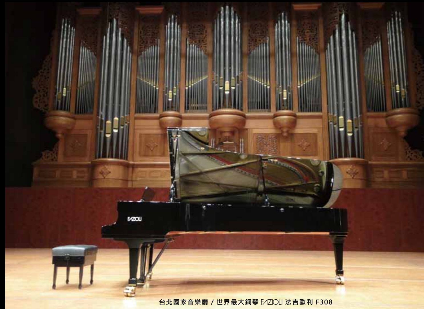
台北國家音樂廳 / 世界最大鋼琴 FAZIOLI 法吉歐利 F308

2014 國際魯賓斯坦鋼琴大賽，最後 6 位決賽者，有 5 位選擇 FAZIOLI 2016 國際雪梨鋼琴大賽，最後決賽 12 場，有 7 場選擇 FAZIOLI